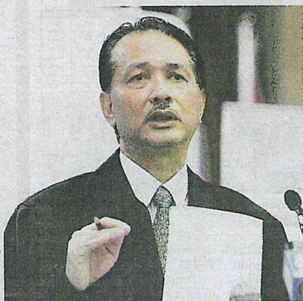
Dr Noor Hisham bercakap pada sidang akhbar harian berkaitan Jangkitan Covid-19 di Kementerian Kesihatan di Putrajaya semalam.

"Contohnya ada empat kumpulan ubat, Malaysia dikenal pasti sebagai sebu-