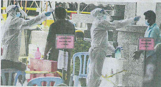
SEBANYAK 50 kes baharu jangkitan direkodkan semalam.

"Beliau dirawat di sebuah klinik swasta pada 16 Mac dan disyaki sebagai menghidap demam denggi. Kesokannya, beliau merentas beberapa negeri untuk me-