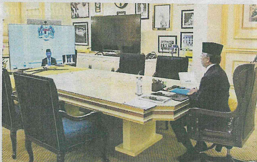
Al-Sultan Abdullah berkenan mengadakan sesi pra-Kabinet bersama Muhyiddin menerusi sidang video di Istana Negara, Kuala Lumpur, semalam.